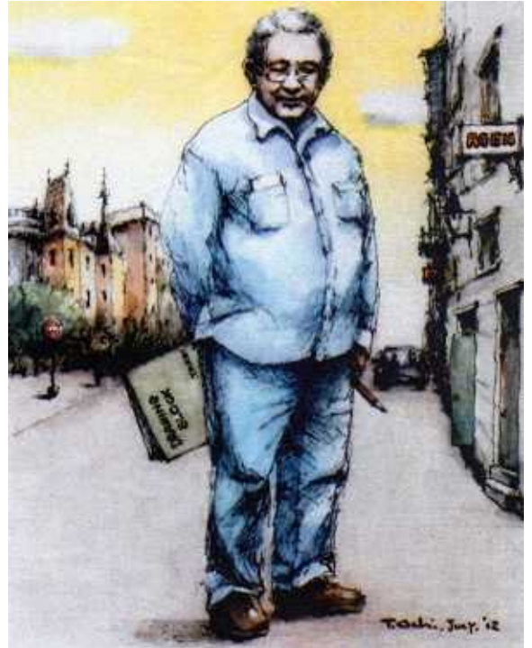
(文&挿絵「アジャン追憶」越智 強)

いま、武居先輩は、天国で愛犬をお供にスケッチブックを片手に、次の大作の画稿を練っておられる頃でしょうか。どうか、安らかにおやすみください。合掌。