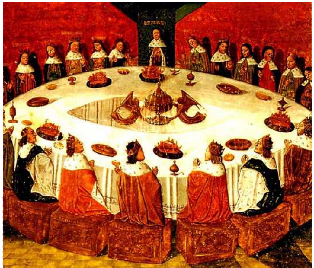
アーサー王と円卓の 騎士を描いた中世の 西洋画