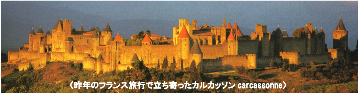
(昨年のフランス旅行で立ち寄ったカルカソン carcassonne)