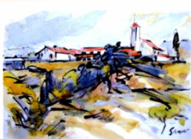
水彩 ワイン城 330mm×235mm

2009年10月1日(木)～6日(火) 11:00AM～6:00PM(最終日 4:00PM)